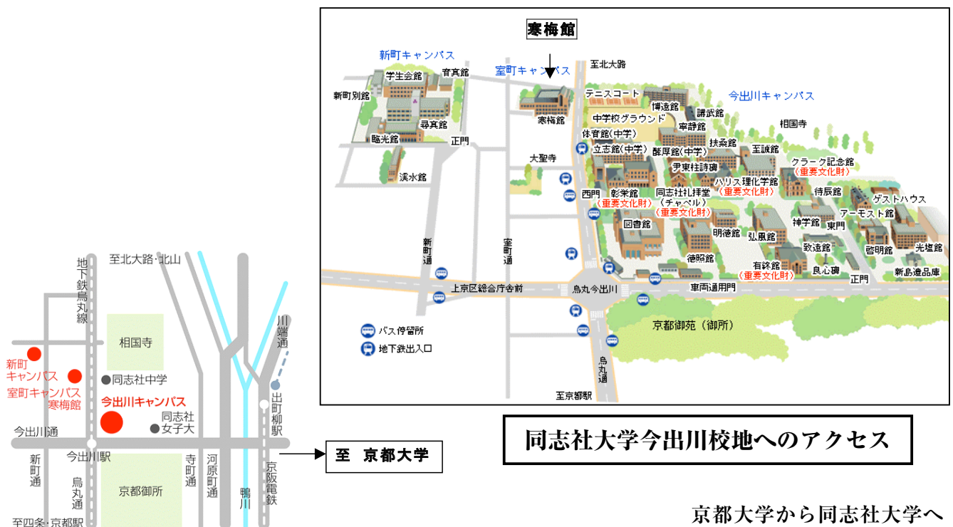
同志社大学今出川校地へのアクセス

*京都大学からは百万遍バス停より京都市バス203号系統にて烏丸今出川下車 徒歩3分 またはタクシーに分乗してお越しください。