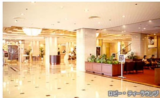
ロビー・ティールounge